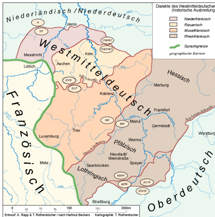
Abb.2: Dialekte des Westmitteldeutschen

Aus: Uni Trier: Überblick über die westmitteldeutschen Dialekte. http://urts96.uni-trier.de:8080/Projects/cil_praktikum/Schulprojekt%20I%20(Praxis%20-%20Texterschliessung)/sprache .